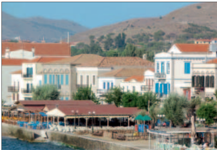
Tavernen am Romeikos Gialos Strand

Die Hauptspeisen der griechischen bzw. der limnischen Küche sind eine Schatzgrube für jeden Feinschmecker. Beim Bestellen der Speisen ist zu beachten, dass man sich schon an den Vorspeisen ( Orektika ) leicht satt essen kann. In Griechenland ist es auch kein Problem, eine Hauptspeise für zwei Personen zu bestellen, was in unseren Breiten in den Restaurants oft nicht geduldet oder zumindest nicht gerne gesehen wird. Das Gedeck, das immer aus Weißbrot und Wasser besteht, wird zu allen Gerichten serviert und auch in der Rechnung ausgewiesen. Zum Essen trinkt man Bier, Wein, Wasser oder andere antialkoholische Getränke. Besonders erwähnenswert ist der köstliche limnische Wein, dem in diesem Buch ein eigener Beitrag gewidmet ist. Ouzo , Tsipouro und Raki werden meist vor den Mahlzeiten als Aperitif mit kleinen Appetithäppchen ( Mezédés ) eingenommen.