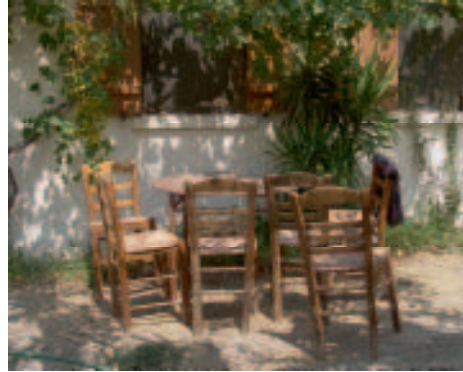
Einladung zum Verweilen

Ouzo , ein hochprozentiger Anisschnaps, den man pur oder mit Wasser und Eis trinkt, sowie Tsipouro (Tresterbrand) oder Raki eignen sich wunderbar als Aperitif. Meist werden zur Bestellung Nüsse, Kartoffelchips oder Oliven gereicht. In einigen traditionellen Tavernen, die vom Tourismus noch verschont geblieben sind, werden zum Ouzo auch Mezédés (kleine Appetithappen) serviert; diese sind im Preis des Getränks mit inbegriffen. Auf kleinen Tellerchen werden gegrillter Oktopus, Sardinen oder Anchovis, Gurkenscheiben und Tomatenstücke, Käsewürfel und andere Leckerein serviert. Sollten diese Mezédés nicht automatisch mit dem Ouzo kommen, besteht die Möglichkeit, diese extra zu bestellen. Fragen sie einfach nach einer kleinen Zusammenstellung von Vorspeisen ( Pikíllia ).