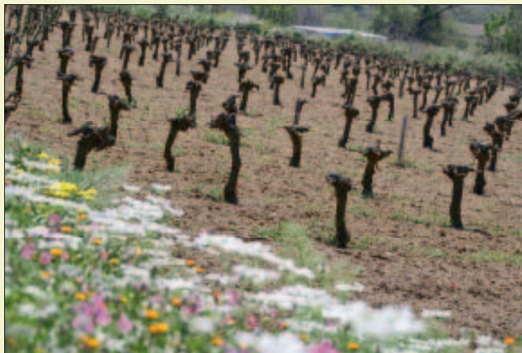
Rebstöcke der Sorte Muskat von Alexandria