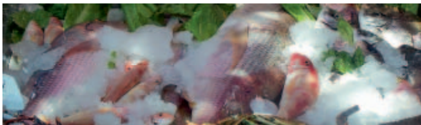
Fangfrische Köstlichkeiten des Meeres

Mousakás melitzánes – ein Auflauf aus Kartoffeln, Hackfleisch, Auberginen und Sauce Bechamel, der im Rohr warm gehalten wird. Pastítio – ein Auflauf aus Makkaroni und Hackfleisch. Páidákia – gegrillte, mit Knoblauch und Oregano gewürzte Lammkoteletts. Kléftiko – im Rohr geschmortes Lammfleisch mit Kartoffeln. Kotópoulo lemonáto – Huhn in Zitronensauce. Kounéli stifádo – im Backofen gegartes Kaninchen mit Öl, Oregano und Zwiebeln. Aftoudia – hausgemachte Gnocchi, eine Spezialität der Insel. Kavourmás – ein Omelette mit Schweinefleisch, auch eine Spezialität der Insel. Spetsosfái – ein pikanter Eintopf mit Wurst, Zwiebeln und Paprika. Moustokoúlika – hausgemachte Nudelspezialität mit Most. Kotópoulo me flomária – Huhn mit hausgemachten Flomari-Nudeln (diese Nudeln werden auf der Insel Limnos produziert und es gibt sie in den verschiedensten Formen). Brizóla – Schweinekotelett. Moschári – Kalbfleisch. Katsikáki – Zicklein. Kótsi me dentrolívano – Schweinestelze mit Rosmarin, eine Köstlichkeit, die man vielleicht von zu Hause kennt, aber unbedingt in ihrer griechischen Variante probieren sollte.