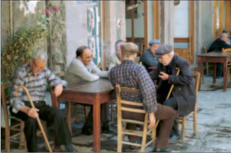
Noch sehr traditionell: Platía von Ántissa