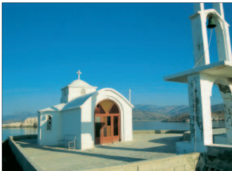
Typisch griechisch: Kapelle bei Gavathás