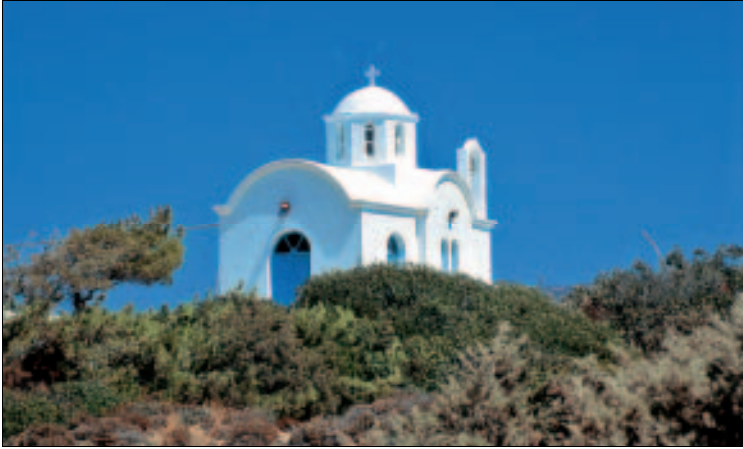
Das weithin sichtbare Wahrzeichen von Amopí – Ágii Apóstoli